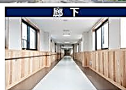
※イメージ写真は老機よるかせ特別支援学校(令和5年4月開校)